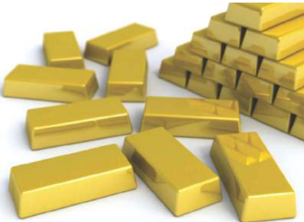
L'or Du Burkina Faso

*Promotion des atouts du Burkina Faso et son environnement économique, social et culturel ;