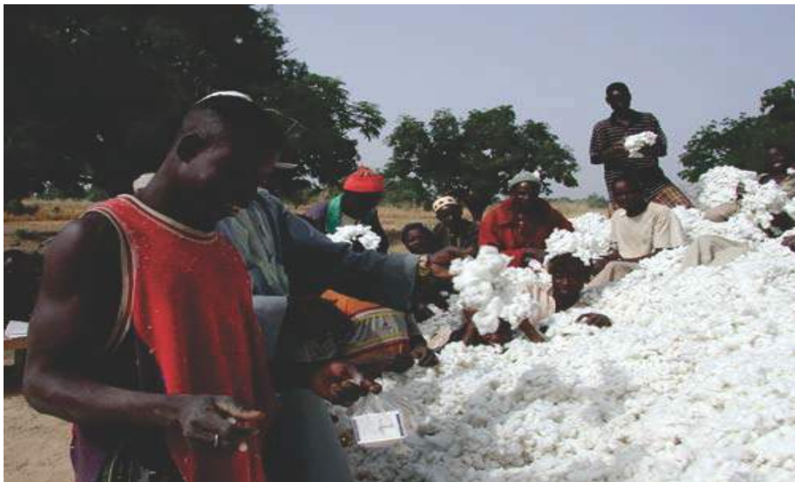
Coton Du Burkina Faso