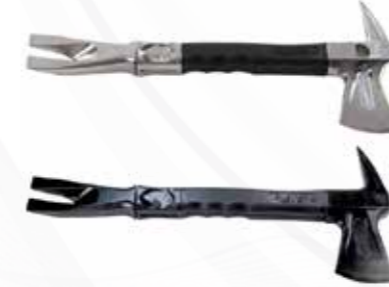
Brèche manuelle الخارق اليدوي