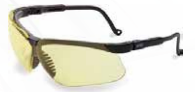
Protection oculaire حماية العين