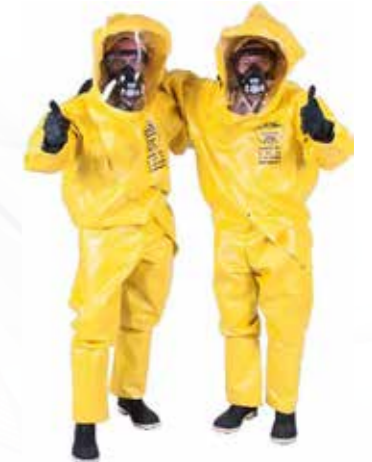
vêtement de substances dangereuses سترات المواد الخطرة