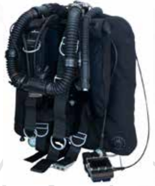
Réservoirs et régulateurs الخزانات والمنظمات