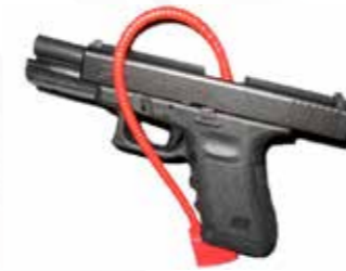
Verrous de sécurité أقفال السلامة