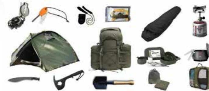
Outils de survie أدوات الإنقاذ