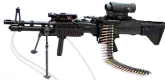
Mitrailleuses lourdes البنادق الآلية الثقيلة