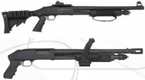
Fusils de chasse شوت قن