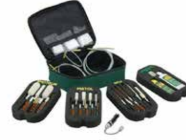
Lots de nettoyage أطقم التنظيف