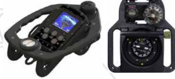
Système de navigation أنظمة الملاحة