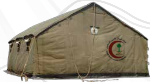
Postes de premiers secours محطات الاسعافات الأولية