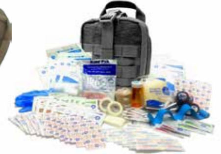
Équipement médical معدات طبية