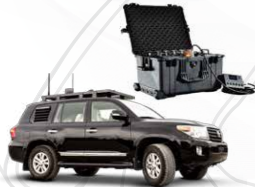
Brouilleur de bombe أجهزة إعاقة المركبات