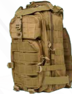
Sacs à dos حقيبة ظهر