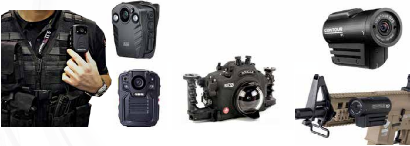
Caméras portées par le corps كاميرات الجسد الأمنية