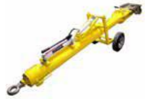
Barres de remorquage عمود سحب