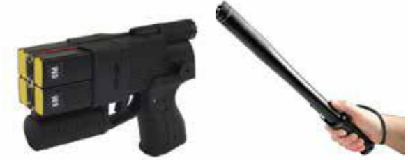
Matraque électrique العصي الكهربائية