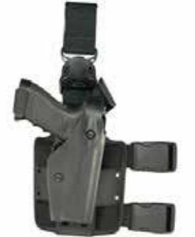
Étuis حوامل الأسلحة