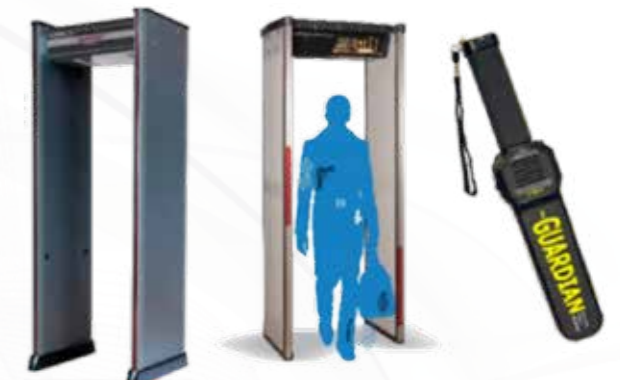
Détecteurs de métaux الكاشف عن المعادن