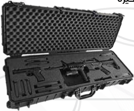
Coffre d'armes حقائب أسلحة