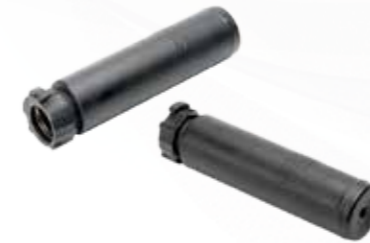
Suppresse urs كواتم الصوت