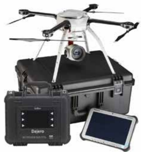
Caméra basée sur drone كاميرات الطائرات الآلية