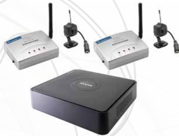
Caméras Espion كاميرات التجسس