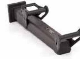
Disjoncteur de porte خارق الأبواب