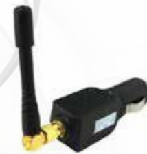
Brouilleur GPS أجهزة إعاقة الـ GPS