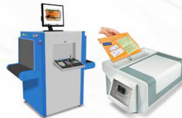
Colis postaux أجهزة فحص الطرود البريدية