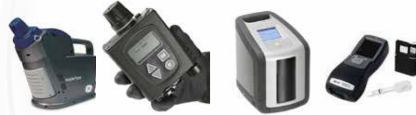
Produits chimiques الكيمائيات