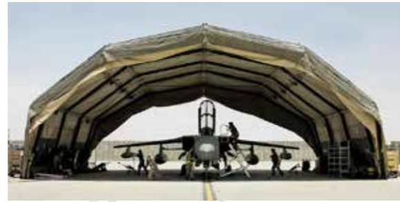
Hangars d'Avions de combat et hélicoptères حظائر الطائرات المقاتلة والهليكابتر