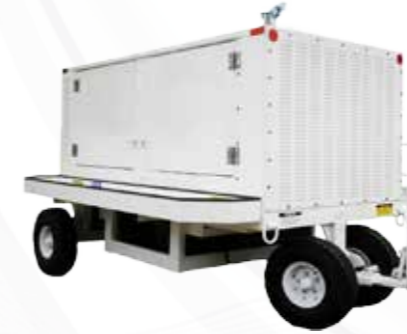
Unités d'appui au sol وحدات الطاقة الأرضية