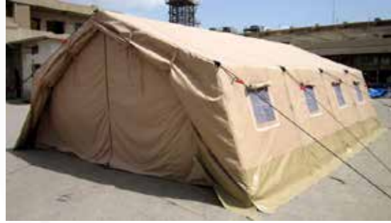
Unités de contamination وحدات التلوث