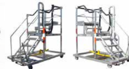
Echelles de ravitaillement سلالم توليد الوقود