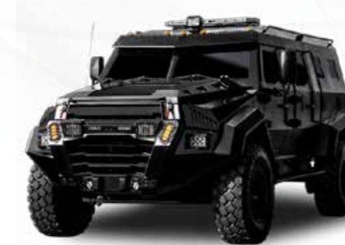
Véhicules polyvalents السيارات متعددة الأدوار