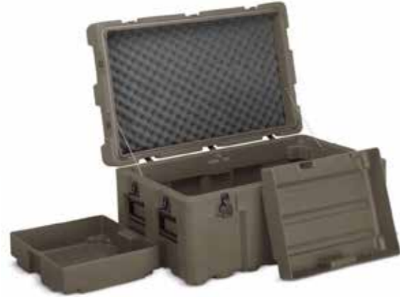
Caisses de munitions حقائب ذخيرة