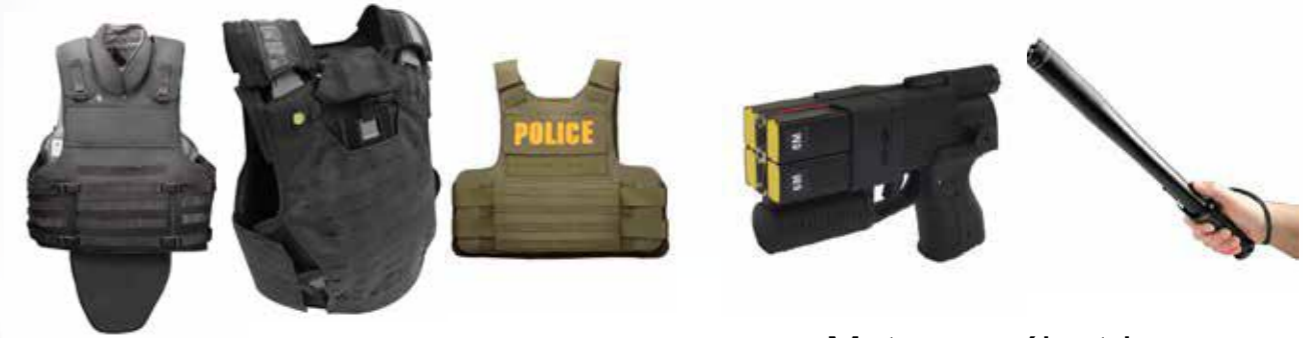
Gilets pare-balles سترات واقية من الرصاص