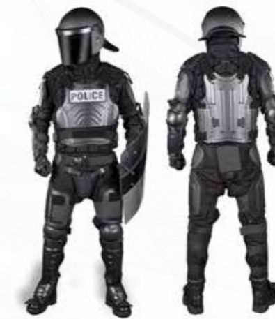
Vêtement anti-émeute سترات مكافحة الشغب