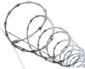
Clôture électrique السياج الكهربائي