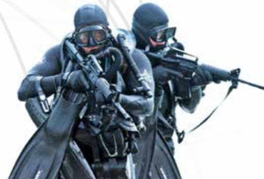
Combinaisons ملابس الغوص