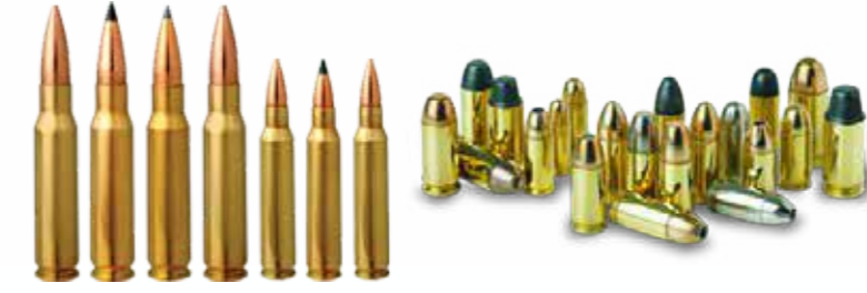
Armes petites et moyennes الذخائر الصغيرة والمتوسطة