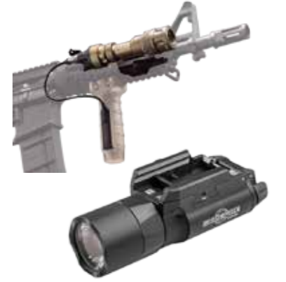
Lampes de poche المصابيح