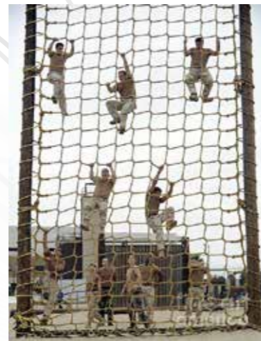
Escalade en corde حبال التسلق