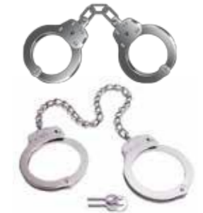
Menottes et poignets قيود الأيدي والأرجل