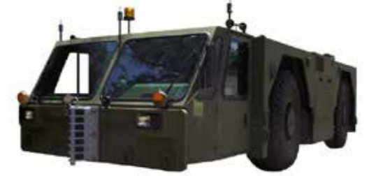
Push back d'avion مصدات دفع الطائرة