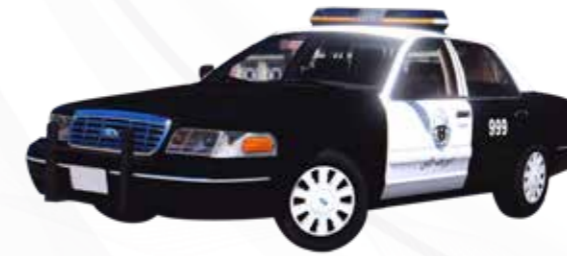
Patrouille de service sur le terrain سيارات الدوريات الميدانية