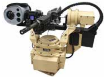
Stations d'arme تélécommandées أجهزة التحكم عن بعد