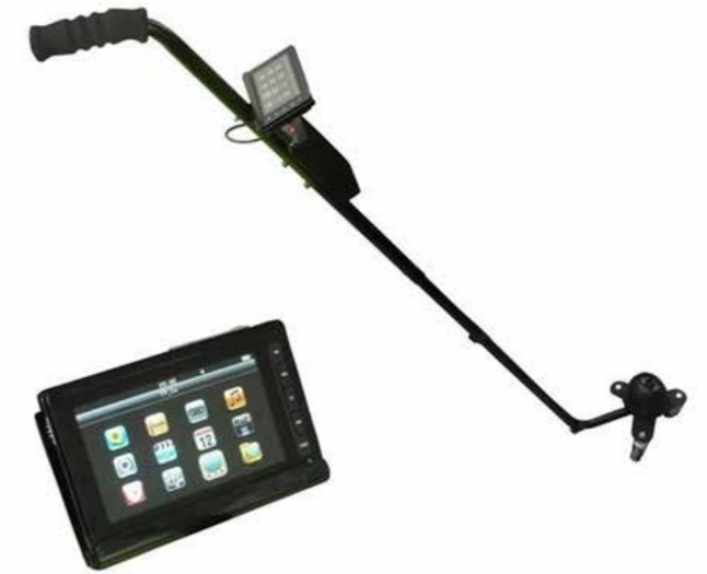
Inspection sous véhicule الماسح الضوئي