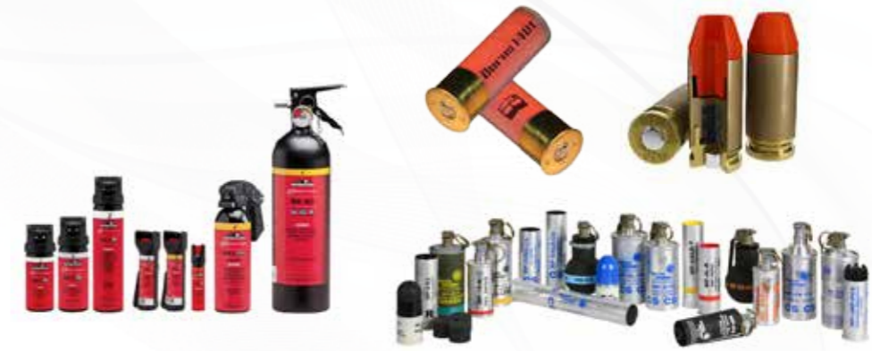
Non mortel ذخائر غير قاتلة