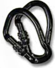
Mousquetons حلقات للربط