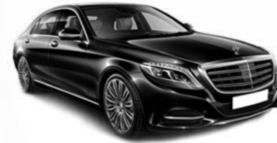
Véhicules de luxe VIP السيارات الدبلوماسية