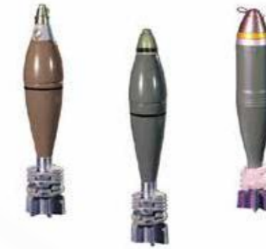
Obus de mortier قذائف الهاون