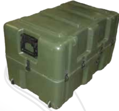
Étuis solides حقائب صلبة