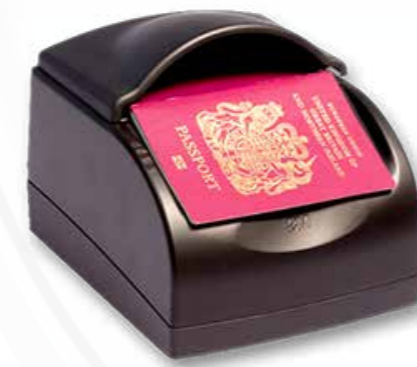
Scanner de passeport الماسح الضوئي