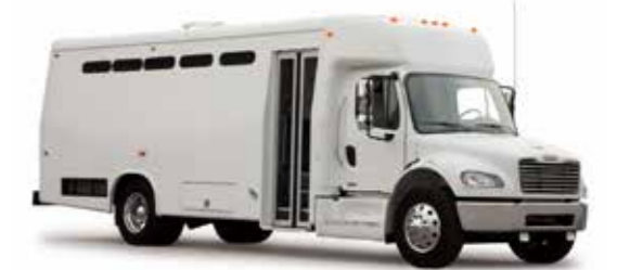
Transporteur de prisonniers ناقلات السجناء