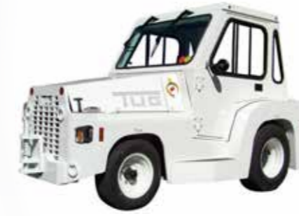
Tracteur de remorquage جرار السحب