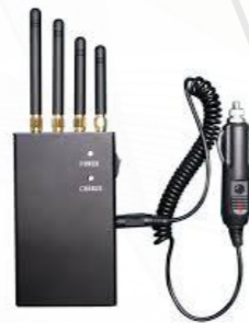
Brouilleur de téléphone portable أجهزة إعاقة الشبكات