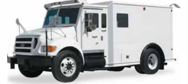
véhicule de transport de fonds سيارات نقل الأموال