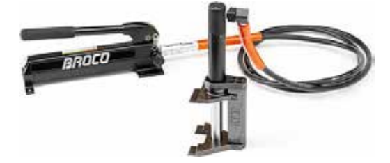
Brèche des portes hydrauliques خارق الأبواب الهيدروليكي