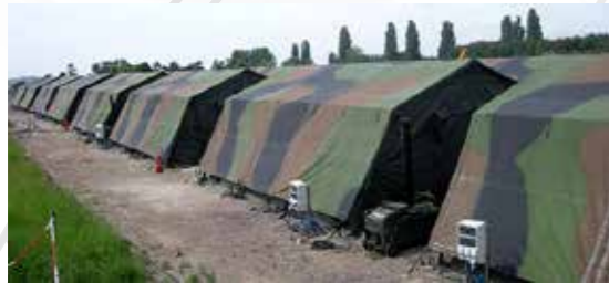
Abris de champs المآوي والمكاتب الميدانية