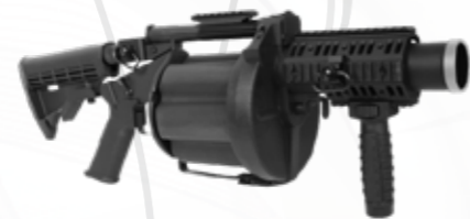
Lanceurs de grenades قاذفات قنابل