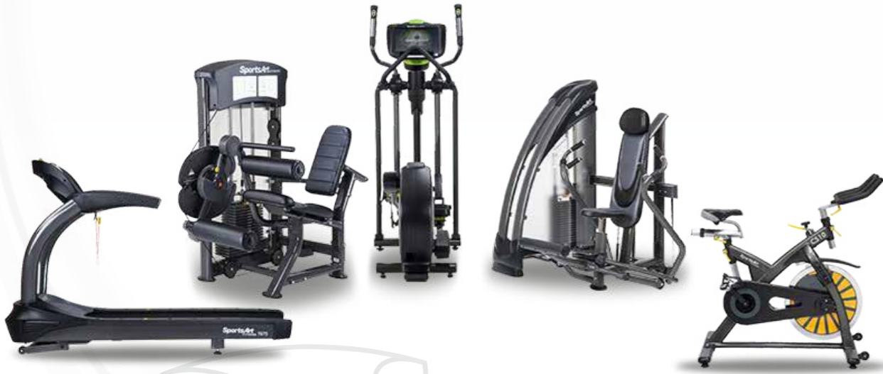
Fournitures sportives مستلزمات صالة اللياقة البدنية