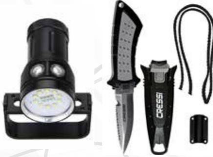
Couteaux et éclairage الألات الحادة والإضاءة