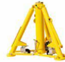
Cric de trépied d'avion ترايبود جاك