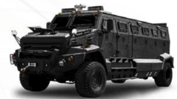
Transporteur de troupes حاملات الجنود