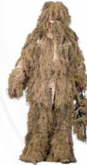
Vêtement de camouflage