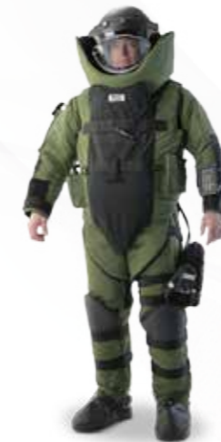
Vêtement d'explosion سترات الانفجارات