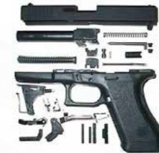
Pièces de rechange قطع الغيار