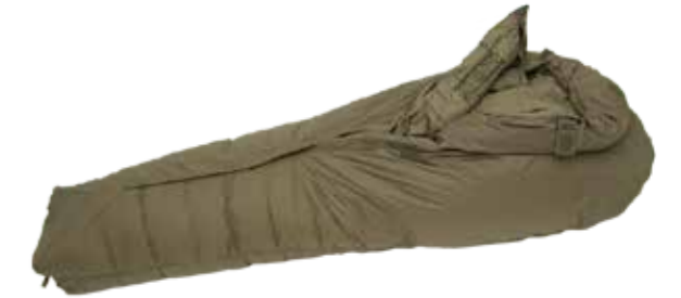
Sac de couchage حقيبة نوم