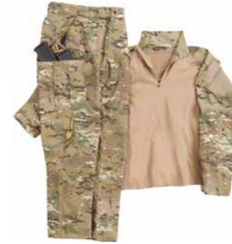
Chemises et pantalons