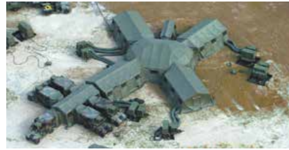
Unités du centre de commandement وحدات مركز القيادة