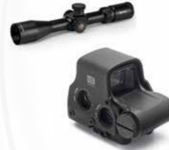
Optique et viseurs البصريات والرؤية